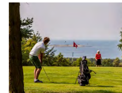
Golfa med havsutsikt på populära Ringenäs Golfklubb.

Utöver sommarens stora golfevenemang erbjuder Halmstad äkta golfupplevelser året runt, med banor i varierande miljö bara en kort bilfärd från city. Inte konstigt att var tionde invånare i kommunen är golfspelare.