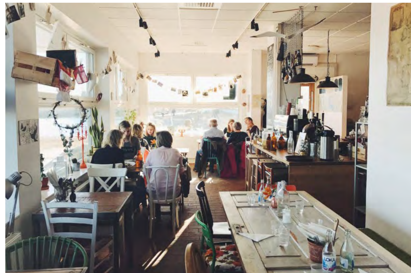
Familjär stämning på Söderfamiljen.