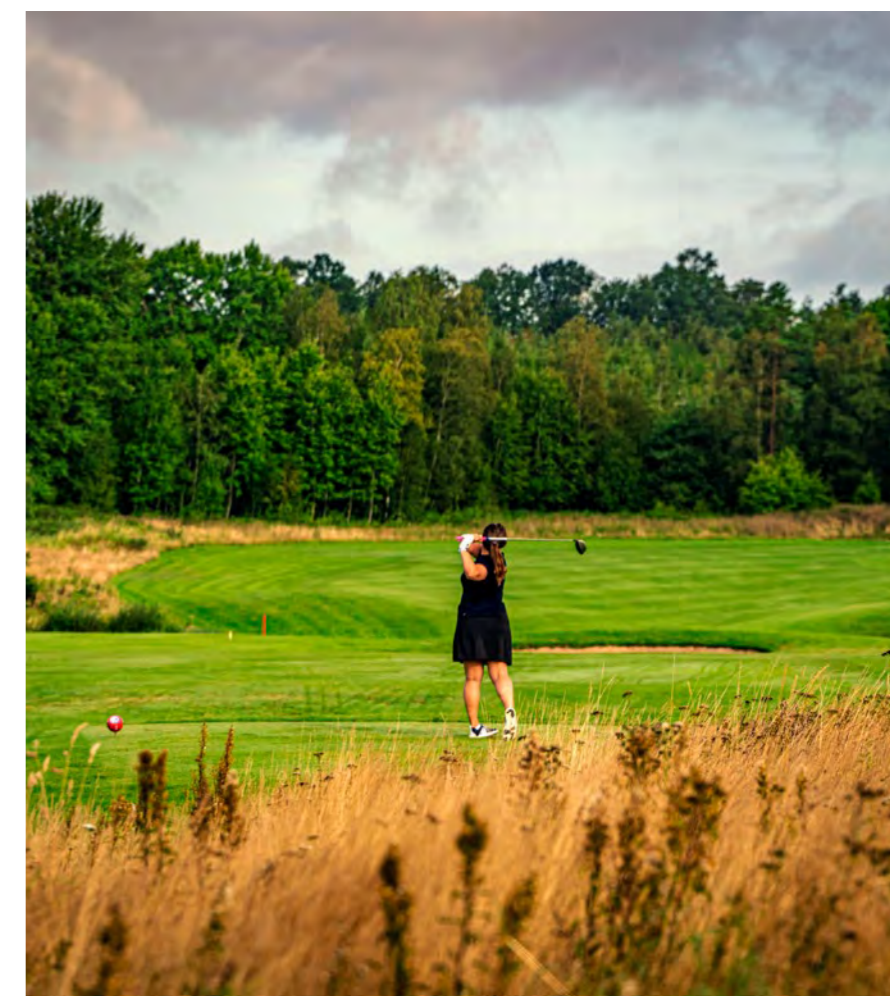
Holms Golfklubb är en naturskön inlandsbana.