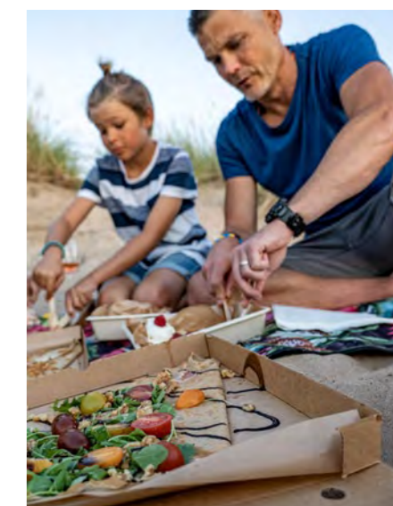
Takeaway från Hygge.