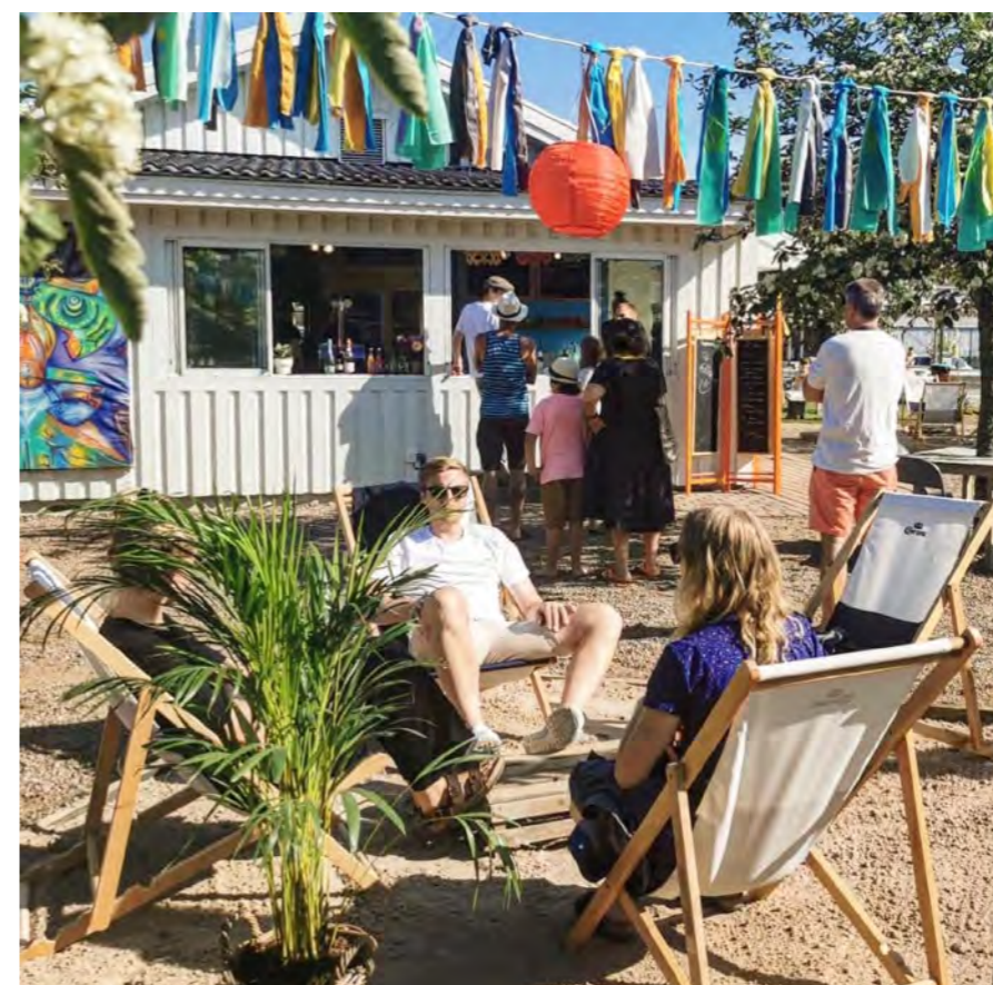
Trädgårdshäng på Agave Glocal i Haverdal.